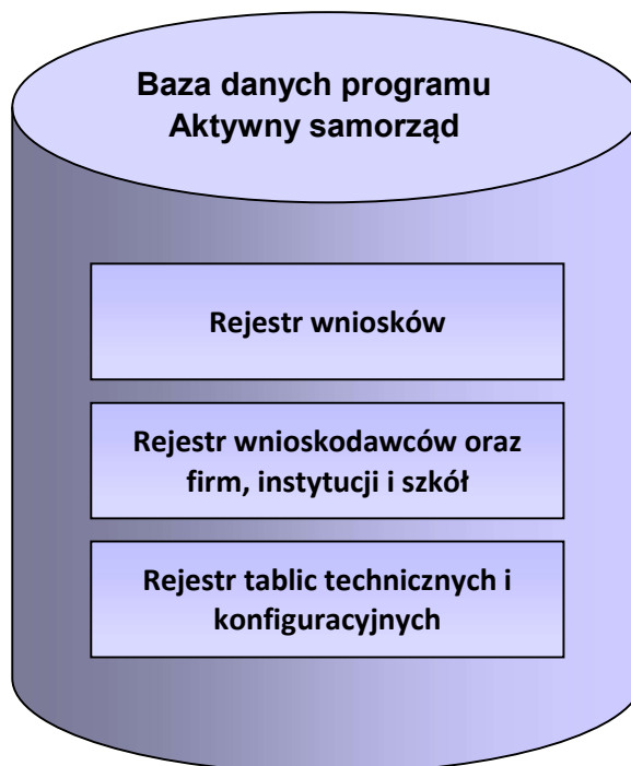
Rysunek 2. Struktura bazy danych.

Ogólny schemat struktury bazy danych przedstawiony jest na Rysunku 2.